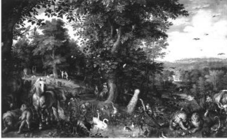
விலங்குகள் சொர்கத்தில் சூக்கும சரீரத்தில் பசி பிணியின்றி வேட்டை, கொலையின்றி சாந்தமாய் வாழ்வதை ஓர் இடைக்கால தைலவண்ண ஓவியம் சித்தரிக்கிறது.